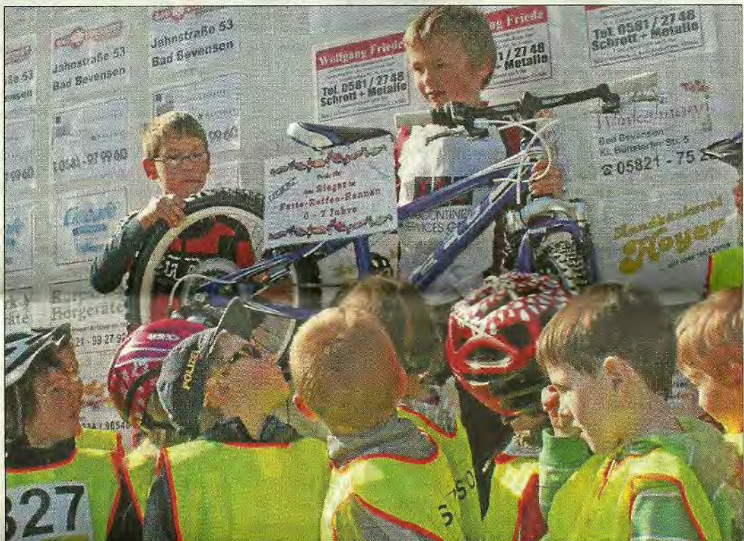
Der Sieger des Fette-Reifen-Rennens der sechs- bis siebenjährigen Radsportler freute sich über den Gewinn eines neuen Mountainbikes.

Für Grundschulkinder im Alter von sechs bis elf Jahren werden Fette-Reifen-Rennen in drei Wertungsklassen (6 bis 7, 8 bis 9 und 10 bis 11 Jahre) über eine Distanz von zwei Kilometern angeboten. Jedes teilnehmende Kind bekommt eine Urkunde und einen Sachpreis – und der Clou: Die Sieger dieser Altersklassen werden mit einem neuen, hochwertigen Mountainbike belohnt.