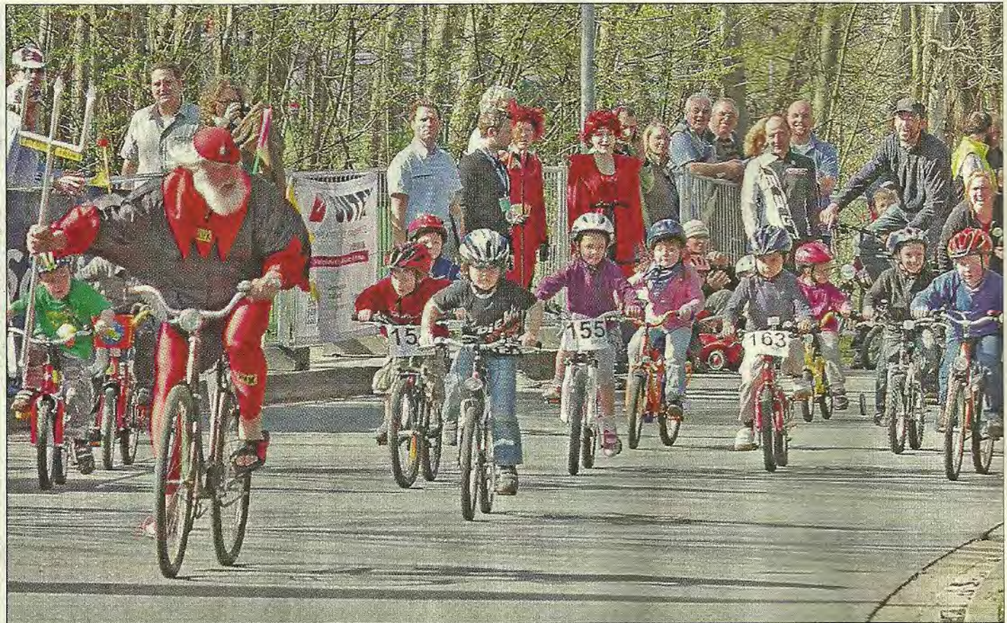
Bei der „Hölle 2011“ sprang Tour de France-Teufel Didi Senft als Führungsfahrer für das Bambini-Radrennen ein.