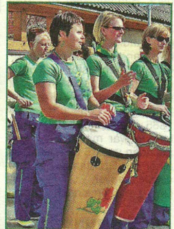
Trommler heitzen die Stimmung an.

Außerdem warten auf die Zuschauer und Teilnehmer viele