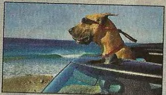
Neue Filmstarts Seite 2