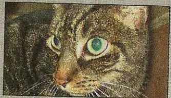
Gizmo abzugeben Seite 2