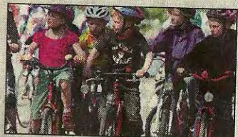
Großes Radrennen Seite 13