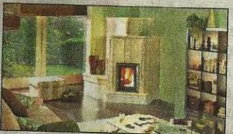
Rund ums Haus Seite 5/6/7