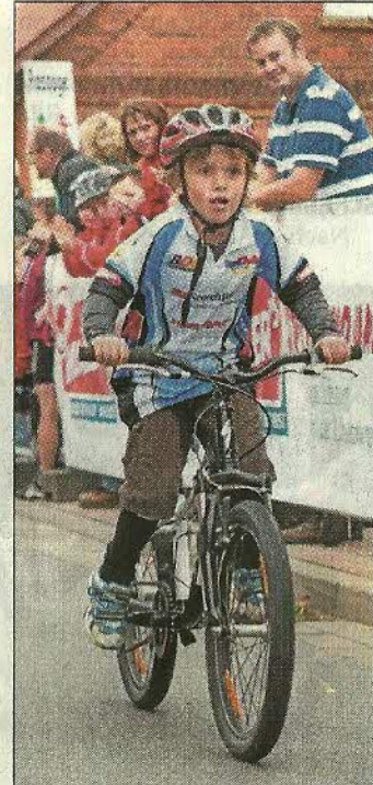
Besonders die jungen Radler waren mit großem Eifer dabei.