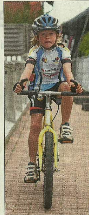
Dieser junge Radsportler ist startklar.