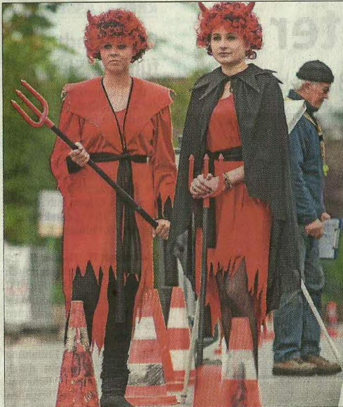
Die roten Teufelchen feuerten die Teilnehmer der Europäischen Radsportwoche wie gewohnt tatkräftig an.