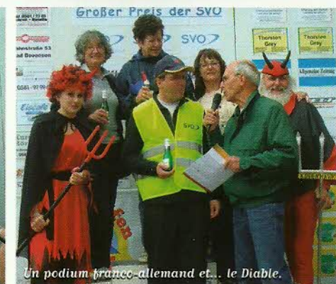
Un podium franco-allemand et... le Diable.