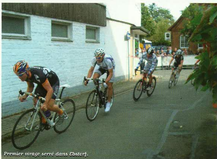
Premier virage serré dans Ebbsortorf.