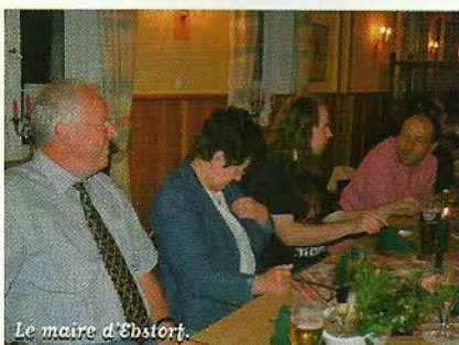
Le maire d'Ebbsortorf.