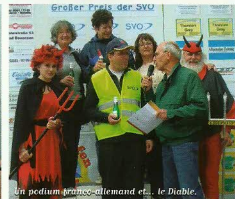
Un podium franco-allemand et... le Diable.