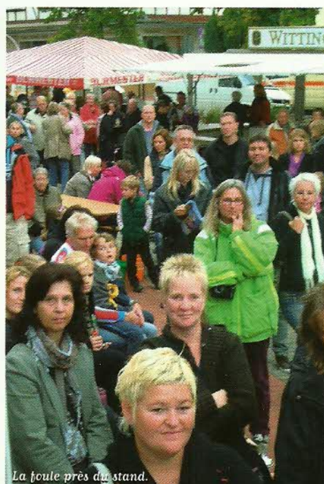
La foule près du stand.