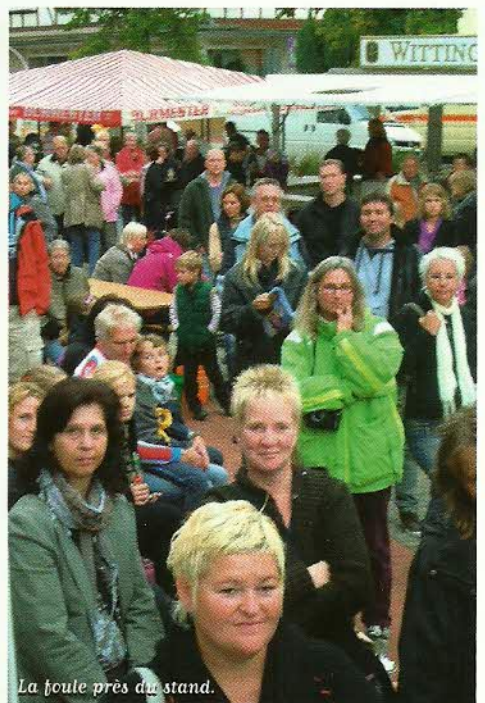
La foule près du stand.