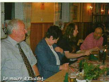
Le maire d'Ebstorf.