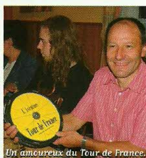
Un amoureux du Tour de France.