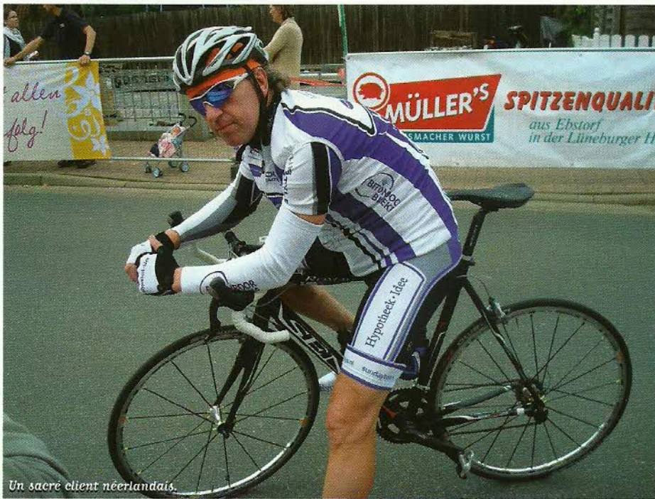
Un sacré client néerlandais.