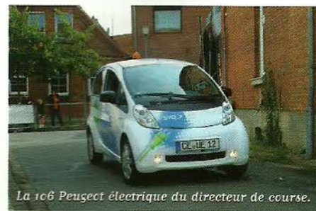
La 106 Peugeot électrique du directeur de course.

Sur un circuit d'une longueur de 1 km en ville, Allemands, Français et Hollandais se sont mesurés (les jeunes, les seniors, les enfants... avec une organisation parfaite, une équipe motivée et des moyens sécurisés.