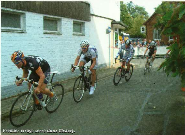
Premier virage serré dans Ebstorf.