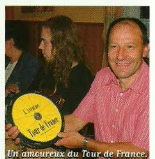
Un amoureux du Tour de France.