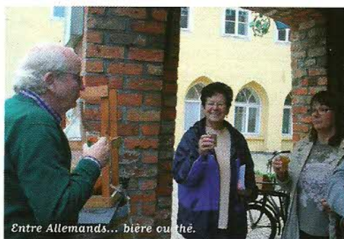
Entre Allemands... bière ou thé.