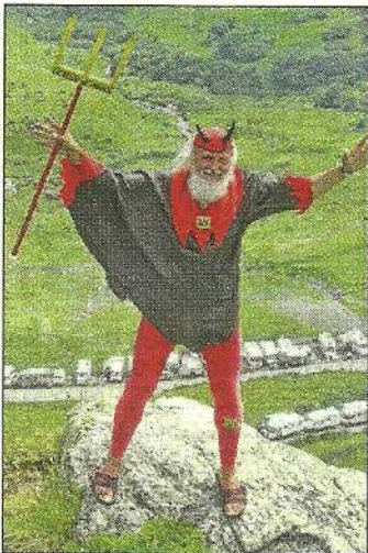
Ist als Ehrengast bei der „Hölle des Nordens“ mit dabei: Der Tour de France-Teufel und Velo-Designer Didi Senft.

Röbbel. Am 9. April um 9 Uhr wird der erste Startschuss des Radsport-Highlights „Die Hölle des Nordens – Großer Preis der SVO“ in Röbbel bei Bad Bevensen fallen. Geboten werden nicht nur spannende Radrennen, sondern vielmehr auch ein buntes Rahmenprogramm für die ganze Familie, das der Veranstaltung einen Volksfestcharakter verleiht. Teilnehmen kann jeder ab einem Jahr, nach oben sind keine Grenzen gesetzt.