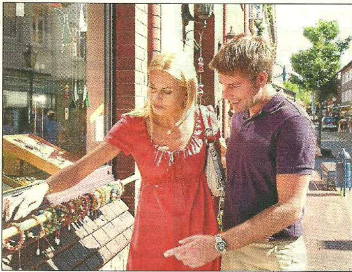
Ein ausgiebiger Einkaufsbummel durch Bad Bevensen lockt an diesem Sonntag.

Einkaufssonntag, Jahrmarkt und Flohmarkt heißen den Frühling willkommen