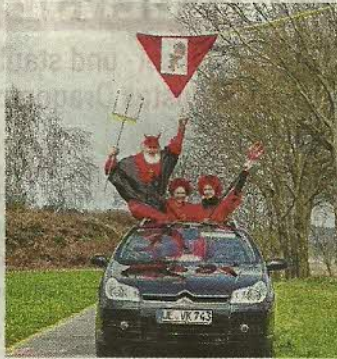
Wir sehen uns in Röbbel!